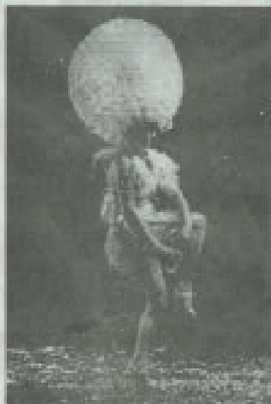
Le plus grand défilé des pelles peintes.

Le plus grand défilé des pelles peintes, par la compagnie antenne C'est-atomik. Une collection très « made in France », pleine de surprises de taille, ce qui est particulièrement le cas avec la robe en ardoise de Tchéco. (Le 7, à 21 h et à 3 minutes).